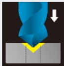
センタリング 面取り同時加工