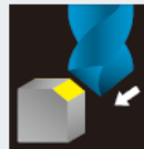
コーナー面取り加工