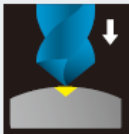
曲面のセンタリング

曲面への穴あけや食付き性の不安定なドリルの前加工にご使用ください。 Utilize pre-hole drilling for curved surface or unstable surface