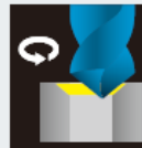
大径穴の面取り加工